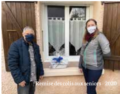
Remise des colis aux seniors - 2020

le CCAS est géré par un Conseil d'Administration composé du Maire, Président de droit, de membres élus en son sein par le Conseil Municipal et de membres nommés parmi des personnes extérieures au Conseil Municipal participant à des actions de prévention, d'animation ou de développement social menées dans la commune.