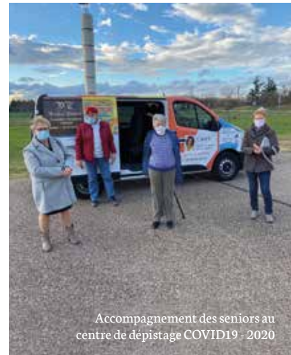
Accompagnement des seniors au centre de dépistage COVID19 - 2020

Coordonnées : Centre Communal d'Action Sociale (CCAS) Mairie de Toussieu Place de la Mairie Téléphone : 04 72 48 09 00 Accueil sur rendez-vous