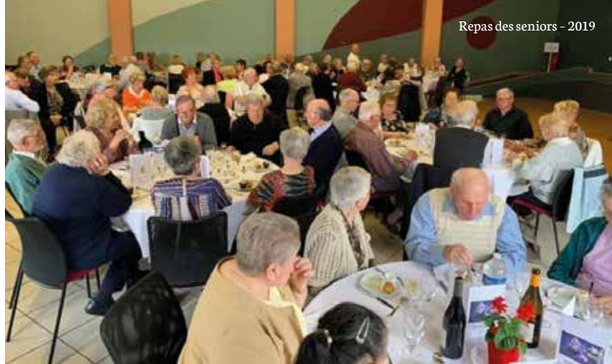
Repas des seniors - 2019