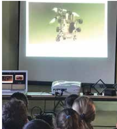
Atelier Culteur'en bus à l'école Jean d'Ormesson

Collèges, bibliothèques, événements, sites touristiques... Dans tous ces lieux, le Culteur'en bus propose un choix d'activités spécialement conçues pour des publics variés. Animées par un médiateur culturel, les activités privilégient les aspects plurisensoriels et ludiques avec des manipulations d'objets de collection, d'outils numériques... Au