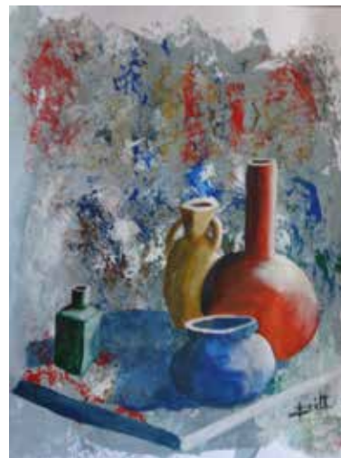
Le petit flacon vert

Maintenant, ce que nous souhaitons, c'est vous montrer notre production. Ces deux pages nous permettent de vous en donner une brève idée. Mais soyez certains que, dès que les conditions le permettront, nous ferons en sorte de vous présenter nos tableaux « en vrai ».