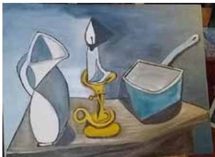
Le monde de Picasso

La peinture reste un excellent exutoire en cette période d'interdits. Par ailleurs, cet exercice nous a permis de ne pas nous désociabiliser totalement. Bien au contraire : nous n'avions jamais autant communiqué.