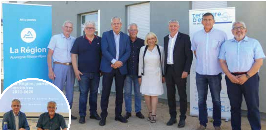
Signature du contrat Région avec les communes de la CCEL